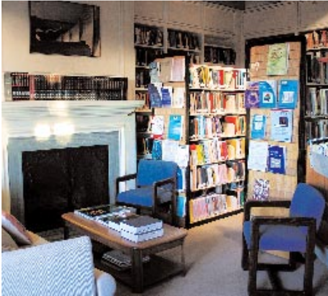
Einsame Experten, selbst mit Nobelpreisen gekürt, nützen dem SFI wenig. Auch die Besten sollen hier noch lernen und ihr Wissen mit anderen teilen.

Gerade deshalb sei es wichtig, einen Ort zu haben, an dem der interdisziplinäre Ansatz nicht verurteilt, sondern gefördert werde.