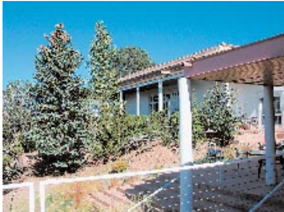
Wissenschaft mit Aussicht: Das Santa Fe Institute unterstützt die Freiheit der Forschung – und macht sich auch gut für die eigene Karriere.

vorgaben zu halten. Das ist verrückt, denn der Weg von der Frage bis zur Erkenntnis kann lang und steinig sein.“